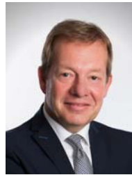
Bürgermeister Steffen Mues (CDU)