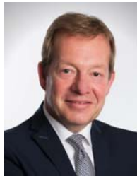
Bürgermeister Steffen Mues