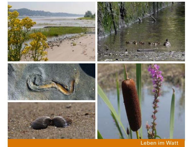
Leben im Watt